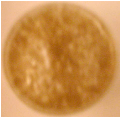
Рис. 3. Контроль чашка Петри в 50 см от телефона микроорганизмы расположены почти равномерно по дну чашки.

5.2.14. Таким образом, «Тест-анализатор» считается работоспособным, так как в нем микроорганизмы изменяют свое пространственное распределение по дну чашки Петри в течение 2 – 3 минут при действии ЭМИ идущего от мобильного телефона или жидкокристаллического экрана монитора. При расположении защитного устройства «Нейтроник» около «Тест-Анализатора», в случае использования мобильного телефона, или внизу экрана монитора, проявляется защитное действие устройства «Нейтроник» и паттерн скопления микроорганизмов, характерный для воздействия ЭМИ, не образуется.